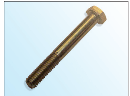
Fig. 2: Tornillo OE

En el marco del desarrollo continuo de nuestros productos y de la seguridad de la calidad INA suministra con la polea tensora 531 0274 30 un nuevo tornillo (fig. 3).