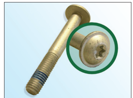
Fig. 3: Tornillo INA

INA recomienda cambiar el tornillo original (fig. 2) por el tornillo suministrado.